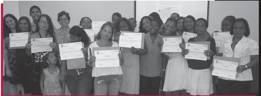
Diplômées du projet Mulheres Mil