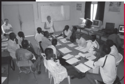
Un projet de l'ÉPE au Sénégal

En 2010-2011, 36 partenariats institutionnels du programme Éducation pour l'Emploi - Afrique impliqués au Sénégal, en Tanzanie et au Mozambique ont réalisé avec succès de nombreuses activités : implication de 188 représentants du secteur privé pour la réalisation d'analyses de situation de travail; formation technique et pédagogique de 490 formateurs; perfectionnement de 69 gestionnaires d'établissements afin d'orienter ces derniers vers une éducation axée sur la demande de l'industrie; et élaboration de 23 programmes suivant l'approche par compétences dans les secteurs d'activités ciblés par les pays partenaires. Les trois forums nationaux organisés ont permis d'accroître les échanges et