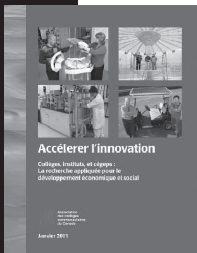
Rapport de recherche de l'ACCC

Plusieurs activités de développement du leadership ont été organisées, dont le Colloque à l'intention des vice-présidents, l'Initiative de développement en leadership pour former de futurs doyens et directeurs et l'Académie des directeurs généraux.