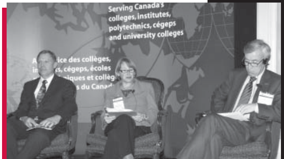
Représentants des conseils subventionnaires à l'ACCC sur la Colline du Parlement

L'ACCC sur la Colline du Parlement a attiré 80 dirigeants de collèges à Ottawa pour rencontrer des élus et des responsables fédéraux et faire connaître le rôle central que jouent les collèges dans le développement économique et social du Canada. Cette campagne comprenait des échanges avec des ministres clés du cabinet, des présidents de comités parlementaires, des chefs de l'opposition, des hauts responsables et des chefs d'organismes de recherche clés. Les dirigeants des collèges ont souligné les priorités de l'ACCC et présenté des exemples d'innovations, de partenariats de collaboration et de programmes exemplaires.