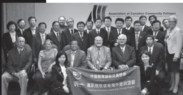
Participants au programme de formation de leadership en éducation professionnelle à l'ACCC

Le 10 décembre 2010, l'ACCC a signé avec l'ACDI un Accord de contribution de 19,000,000 $ pour la mise en œuvre du programme Éducation pour l'Emploi - CARICOM. Ce programme de cinq ans offrira aux collèges et instituts canadiens des possibilités d'appuyer le développement du secteur privé en adaptant l'éducation aux besoins des employeurs, par le biais d'une assistance technique et de 18 partenariats institutionnels dans 10 pays du Caraïbe (Belize, Jamaïque, Guyana, Suriname, Trinidad et Tobago, Barbade et pays membres de l'Organisation des États de la Caraïbe orientale).