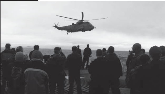
Les représentants des collèges assiste à une démonstration des Forces canadiennes

Des articles traitant de l'ACCC et de l'intégration des immigrants ont été publiés dans un numéro spécial du National Post et dans le « Fall Education Report » publié par Embassy News .