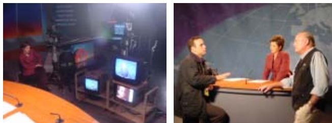
Photos du projet de formation aux médias en Bosnie

Financé par l'Agence canadienne de développement international, le projet de formation aux médias en Bosnie est une initiative sur trois ans qui vise à contribuer à la réforme démocratique en améliorant la gestion, le fonctionnement et la qualité de la télédiffusion en Bosnie-Herzégovine. Travaillant avec le système de télédiffusion public et des stations de télévision choisies, l'ACCC offre ainsi une formation pratique de pointe en journalisme et dans les domaines des techniques de production, du journalisme d'enquête, des applications informatiques, de la gestion et du marketing. Ce projet aide l'industrie à créer des sources de revenu dans le marché et encourage le public à faire confiance au journalisme objectif basé sur les faits de même qu'à la qualité des émissions.